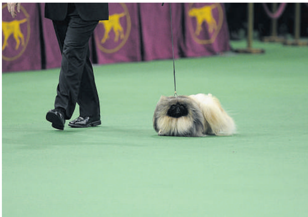
Auch die Schönheit des Pekinesen kann eine Qualzucht sein: Champion an einer Show in New York.