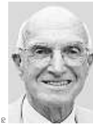
Joseph E. Murray Medizinnobelpreisträger

Wegen der übereinstimmenden Gene mussten die Mediziner sich nicht dem grössten Problem bei Transplantationen stellen, der Abstossungsreaktion des Körpers des Empfängers. Nach der