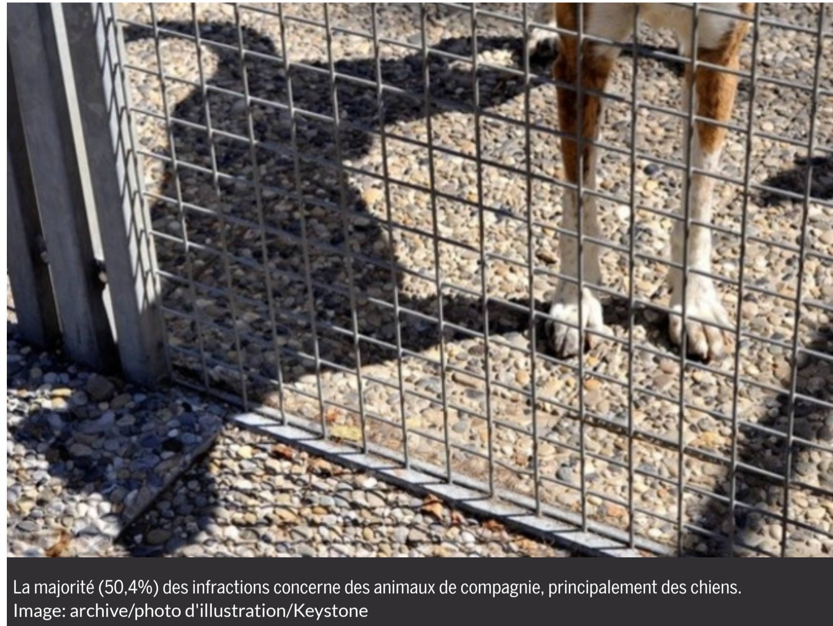
La majorité (50,4%) des infractions concerne des animaux de compagnie, principalement des chiens.

Le nombre de plaintes liées à de la maltraitance animale repart à la hausse. Selon la fondation alémanique Tier im Recht, la majorité des cas concerne des chiens.