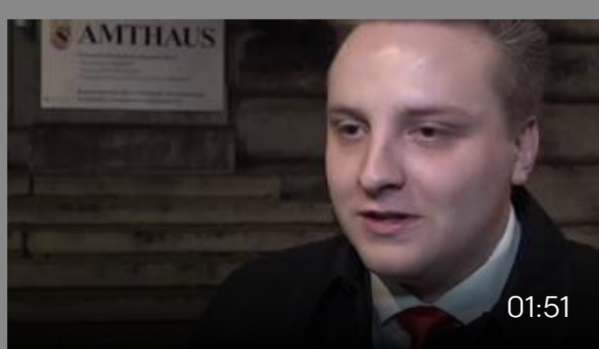
■ «Zigeuner»-Plakat der JSVP: Das sagen die Parteien zur Verurteilung