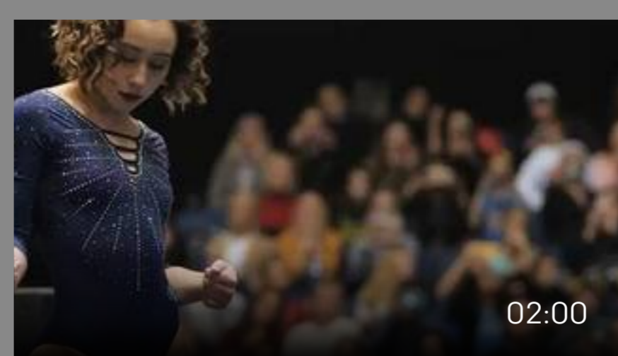
■ Wetten, dass Ihnen nach diesem Video der Mund offensteht?