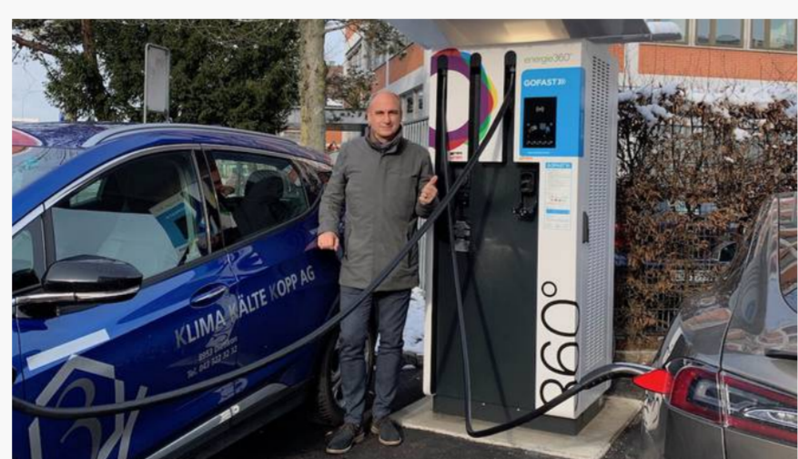
DIETIKON Neue Schnellladestation für Elektroautos eröffnet