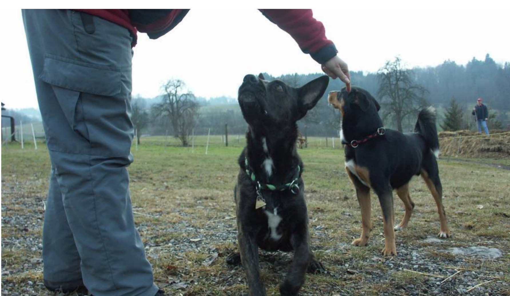
Die Kantonsratsmehrheit will die Hundekurspflicht abschaffen. Nun entscheidet das Volk.

von Matthias Scharrer - az Limmattaler Zeitung • Zuletzt aktualisiert am 16.1.2019 um 09:22 Uhr