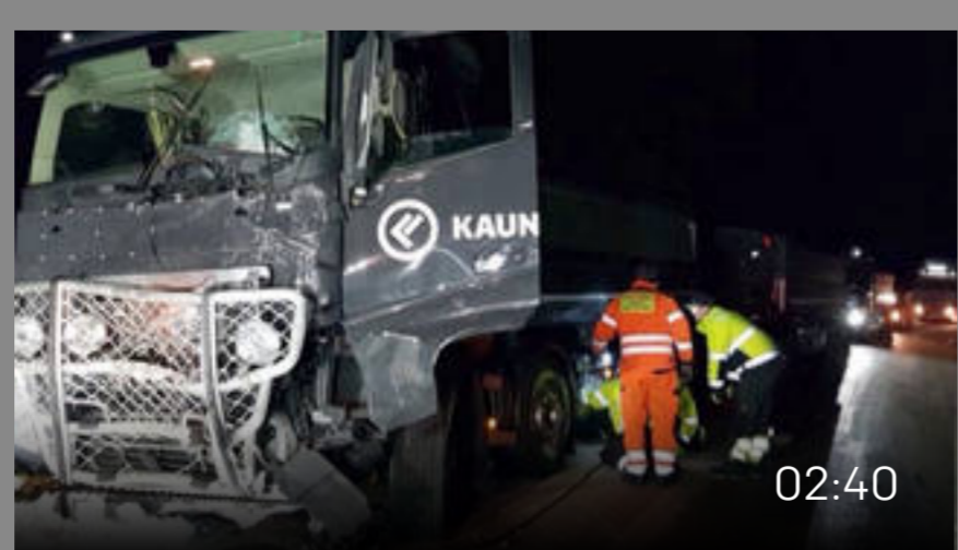
■ Fünf junge Adelbodner sterben bei Busunfall