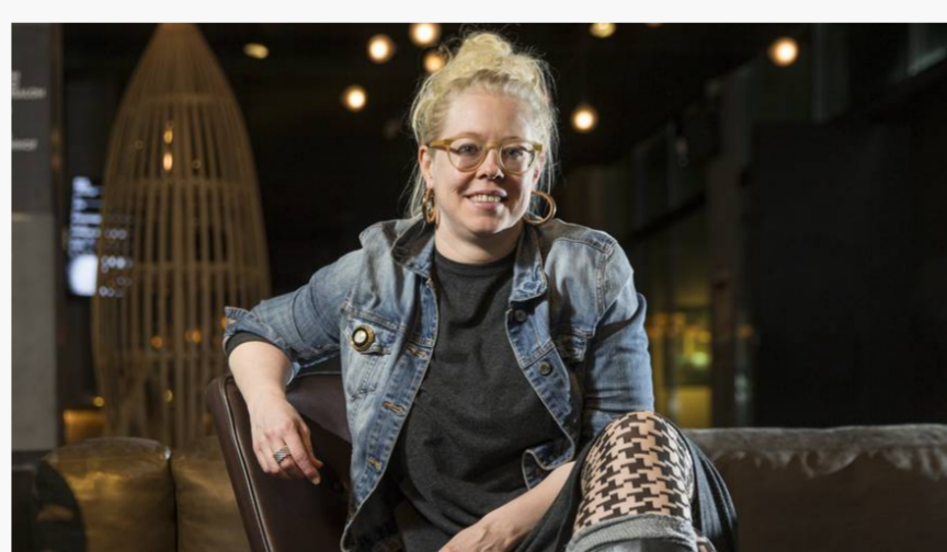
ZÜRICH Sie macht die Philosophie einem breiten Publikum zugänglich

CASTING Dietikon sucht das Singtalent: Der Kampf um den Titel geht los