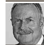
von Ueli Wild

Ein Denkmal für die Menschenrechte verdient die uneingeschränkte Sympathie. Das allein heisst aber noch lange nicht, dass das umstrittene Kunstwerk von Bettina Eichin im Aarauer Kasinopark aufgestellt werden muss. Weshalb soll sich Aarau den unvollendeten Ladenhüter unterjubeln lassen, den niemand haben wollte? Ganz ohne Bezug zu Aarau ist die Menschenrechtsthematik zwar nicht: Den ursprünglichen Basler Initianten ging es darum, Peter Ochs zu ehren. Der Basler Ochs hat 1798 in Aarau die