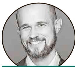
PRO Andreas Rüttimann Stiftung für das Tier im Recht

Zwar besteht sicherlich noch Optimierungsbedarf im Hinblick auf Qualitätssicherung und Kontrolle der Umsetzung. Dies ist jedoch kein Grund, den SKN ganz abzuschaffen. Auch das häufig vorgebrachte Argument, die SKN-Ausbildung sei zu wenig umfassend, spricht nicht für deren Abschaffung, sondern vielmehr dafür, die Kurse noch weiter auszubauen.