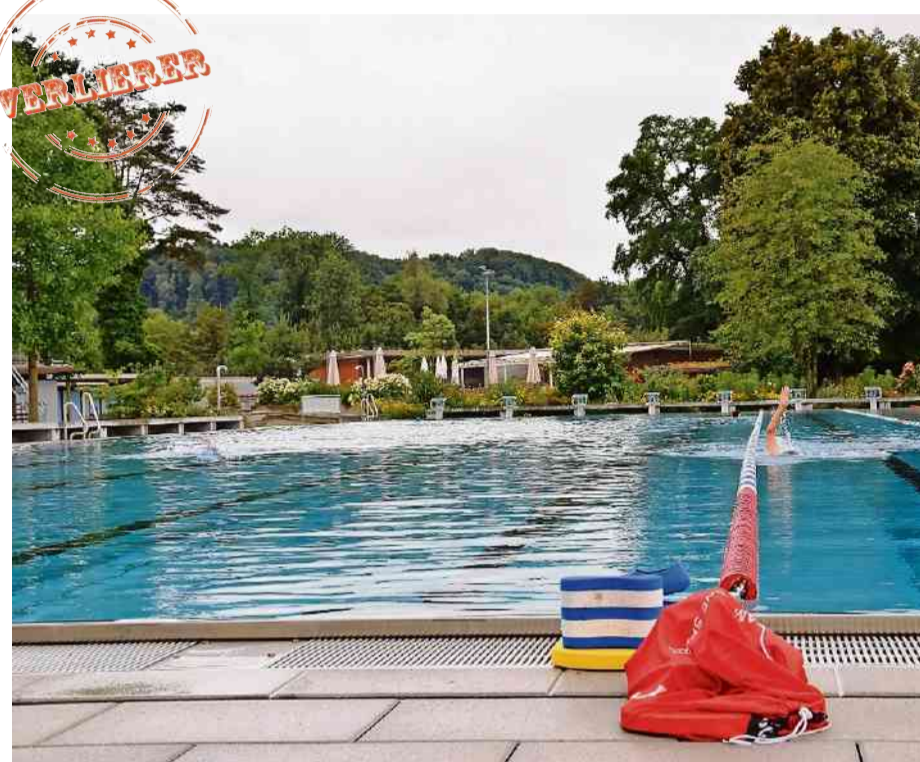
Freibäder wie dasjenige im Aarauner Schachen bleiben derzeit leer. MICHAEL HUNZIKER