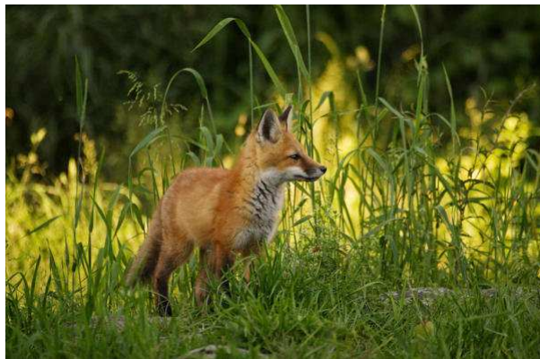
Tierschützer wollen die Jagd auf Füchse mit Hunden verbieten. Jäger halten nichts davon.

Wenn ein Jagdhund einen Fuchs aus seinem Bau holt, ist das oft eine blutige Sache. Tierschutzorganisationen sprechen von Tierquälerei und lancieren eine Petition.